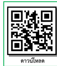
ดาวน์โหลด

หมายเหตุ : กรณีเอกสารตามข้อ ๖ ไม่มีวันสำเร็จการศึกษา ให้ส่งหนังสือขอผ่อนผันเอกสารหลักฐานการรายงานตัวฯ พร้อมแนบใบรับรองผลการเรียน/ใบเกรดที่มีชื่อสถานศึกษา สามารถดาวน์โหลดหนังสือขอผ่อนผันเอกสารหลักฐานการรายงานตัวฯได้ที่ https://regis.rmuti.ac.th/online/