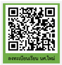
ลงทะเบียนเรียน นศ.ใหม่

ขั้นตอนที่ 4 ลงทะเบียนเรียนนักศึกษาใหม่และพิมพ์ใบรายงานการลงทะเบียน/ใบแจ้งชำระเงิน ปีการศึกษา 2566 ผ่านระบบบริการการศึกษา (ESS) https://ess.rmuti.ac.th/Rmuti/Registration/ ซึ่งจะมีรายการค่าใช้จ่าย ค่าประกันของเสียหาย ค่าประกันอุบัติเหตุ และค่าหอพัก นำไปชำระเงินผ่านธนาคารกรุงไทย จำกัด(มหาชน)/ ธนาคารกรุงศรีอยุธยา จำกัด(มหาชน) ได้ทุกสาขาทั่วประเทศ วันที่ 7 – 9 มิถุนายน 2566