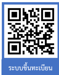
ระบบขึ้นทะเบียน

ผ่านระบบบริการการศึกษา (ESS) https://ess.rmuti.ac.th/Rmuti/Registration/ เพื่อนำไปชำระเงินผ่านธนาคารกรุงไทย จำกัด (มหาชน) / ธนาคารกรุงศรีอยุธยา จำกัด (มหาชน) ได้ทุกสาขาทั่วประเทศ