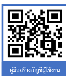
คู่มือสร้างบัญชีผู้ใช้งาน