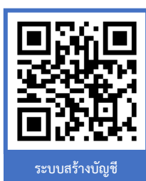
ระบบสร้างบัญชี

https://ess.rmuti.ac.th/Rmuti/Registration/ หลังจากกำหนดการขึ้นทะเบียนนักศึกษา และชำระเงินค่าธรรมเนียมการศึกษา 2 วันเพื่อรับรหัสประจำตัวนักศึกษา