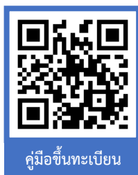
คู่มือขึ้นทะเบียน