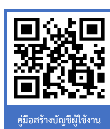
คู่มือสร้างบัญชีผู้ใช้งาน