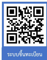
ระบบขึ้นทะเบียน

ผ่านระบบบริการการศึกษา (ESS) https://ess.rmuti.ac.th/Rmuti/Registration/ เพื่อนำไปชำระเงินผ่านธนาคารกรุงไทย จำกัด (มหาชน) / ธนาคารกรุงศรีอยุธยา จำกัด (มหาชน) ได้ทุกสาขาทั่วประเทศ