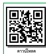
ดาวน์โหลด

*** 2. สามารถดาวน์โหลดขั้นตอนการรายงานตัวหรือหนังสือขอผ่อนผันเอกสารหลักฐานการรายงานตัวฯ ได้ที่ https://regis.rmuti.ac.th/online/