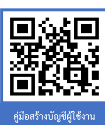
คู่มือสร้างบัญชีผู้ใช้งาน