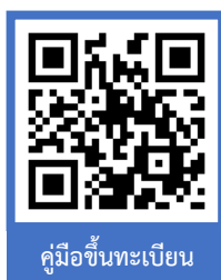
คู่มือขึ้นทะเบียน