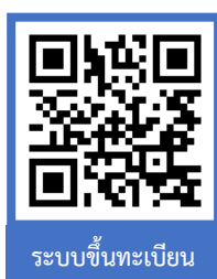
ระบบขึ้นทะเบียน

1.1 กรอกข้อมูลประวัตินักศึกษา และพิมพ์ใบแจ้งชำระเงินขึ้นทะเบียนนักศึกษา/ใบเสร็จรับเงิน ผ่านระบบบริการการศึกษา (ESS) https://ess.rmuti.ac.th/Rmuti/Registration/ เพื่อนำไปชำระเงินผ่าน ธนาคารกรุงไทย จำกัด (มหาชน) / ธนาคารกรุงศรีอยุธยา จำกัด (มหาชน) ได้ทุกสาขาทั่วประเทศ