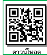
ดาวน์โหลด

*** 2. สามารถดาวน์โหลดขั้นตอนการรายงานตัวหรือหนังสือขอผ่อนผันเอกสารหลักฐานการรายงานตัวฯ ได้ที่ https://regis.rmuti.ac.th/online/