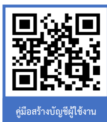
คู่มือสร้างบัญชีผู้ใช้งาน