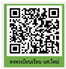
ลงทะเบียนเรียน นศ.ใหม่

ขั้นตอนที่ 4 ลงทะเบียนเรียนนักศึกษาใหม่และพิมพ์ใบรายงานการลงทะเบียน/ใบแจ้งชำระเงิน ปีการศึกษา 2566 ผ่านระบบบริการการศึกษา (ESS) https://ess.rmuti.ac.th/Rmuti/Registration/ ซึ่งจะมีรายการค่าใช้จ่าย ค่าประกันของเสียหาย ค่าประกันอุบัติเหตุ และค่าหอพัก นำไปชำระเงินผ่านธนาคารกรุงไทย จำกัด(มหาชน)/ ธนาคารกรุงศรีอยุธยา จำกัด(มหาชน) ได้ทุกสาขาทั่วประเทศ วันที่ 15 - 18 มิถุนายน 2566