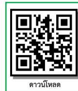
ดาวน์โหลด

*** 2. สามารถดาวน์โหลดขั้นตอนการรายงานตัวหรือหนังสือขอผ่อนผันเอกสารหลักฐานการรายงานตัวฯ ได้ที่ https://regis.rmuti.ac.th/online/