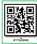
ดาวน์โหลด

*** ๒. สามารถดาวน์โหลดขั้นตอนการรายงานตัวหรือหนังสือขอผ่อนผันเอกสารหลักฐานการ รายงานตัวฯ ได้ที่ https://regis.rmuti.ac.th/online/