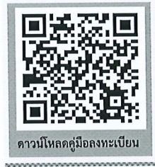
ดาวน์โหลดคู่มือลงทะเบียน