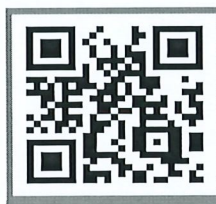
คู่มือสร้างบัญชีผู้ใช้งาน

ขั้นตอนที่ 2 ส่งเอกสารรายงานตัวนักศึกษาใหม่ วันที่ 21 พฤษภาคม 2567