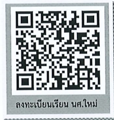
ลงทะเบียนเรียน นศ.ใหม่

ขั้นตอนที่ 3 ลงทะเบียนเรียนนักศึกษาใหม่และพิมพ์ใบรายงานการลงทะเบียน/ใบแจ้งชำระเงิน ปีการศึกษา 2567 ผ่านระบบบริการการศึกษา (ESS) https://ess.rmuti.ac.th/Rmuti/Registration/ ซึ่งจะมีรายการค่าใช้จ่าย ค่าประกันของเสียหาย ค่าประกันอุบัติเหตุ นำไปชำระเงินผ่านธนาคารกรุงไทย จำกัด(มหาชน)/ ธนาคารกรุงศรีอยุธยา จำกัด (มหาชน) ได้ทุกสาขาทั่วประเทศ วันที่ 6 - 7 มิถุนายน 2567