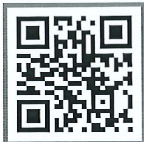
ระบบสร้างบัญชี

ค่าธรรมเนียมการศึกษา 3 วันเพื่อรับรหัสประจำตัวนักศึกษา