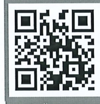
คู่มือขึ้นทะเบียน