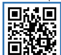
รายละเอียดค่าใช้จ่าย

ผ่านระบบบริการการศึกษา (ESS) https://ess.rmuti.ac.th/Rmuti/Registration/ เพื่อนำไปชำระเงินผ่านธนาคารกรุงไทย จำกัด (มหาชน) / ธนาคารกรุงศรีอยุธยา จำกัด(มหาชน) ได้ทุกสาขาทั่วประเทศ