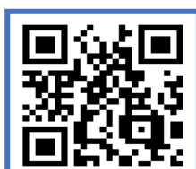
คู่มือสร้างบัญชีผู้ใช้งาน