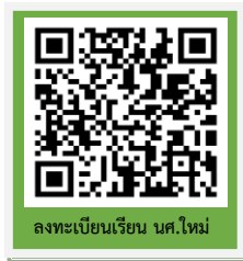
ลงทะเบียนเรียน นศ.ใหม่

ขั้นตอนที่ 3 ลงทะเบียนเรียนนักศึกษาใหม่และพิมพ์ใบรายงานการลงทะเบียน/ใบแจ้งชำระเงิน ปีการศึกษา 2567 ผ่านระบบบริการการศึกษา (ESS) https://ess.rmuti.ac.th/Rmuti/Registration/ ซึ่งจะมีรายการค่าใช้จ่าย ค่าประกันของเสียหาย ค่าประกันอุบัติเหตุ นำไปชำระเงินผ่านธนาคารกรุงไทย จำกัด(มหาชน)/ ธนาคารกรุงศรีอยุธยา จำกัด (มหาชน) ได้ทุกสาขาทั่วประเทศ วันที่ 12 มิถุนายน 2567