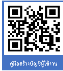
คู่มือสร้างบัญชีผู้ใช้งาน