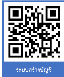
ระบบสร้างบัญชี

3.2 สร้างบัญชีผู้ใช้งานผ่านระบบบริการการศึกษา (ESS) https://ess.rmuti.ac.th/Rmuti/Registration/ หลังจากกำหนดการขึ้นทะเบียนนักศึกษา และชำระเงินค่าธรรมเนียมการศึกษา 3 วันเพื่อรับรหัสประจำตัวนักศึกษา