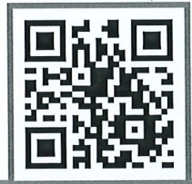
รายละเอียดค่าใช้จ่าย

ผ่านระบบบริการการศึกษา (ESS) https://ess.rmuti.ac.th/Rmuti/Registration/ เพื่อนำไปชำระเงินผ่านธนาคารกรุงไทย จำกัด (มหาชน) / ธนาคารกรุงศรีอยุธยา จำกัด (มหาชน) ได้ทุกสาขาทั่วประเทศ