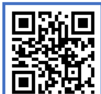
ระบบสร้างบัญชี

ค่าธรรมเนียมการศึกษา 3 วันเพื่อรับรหัสประจำตัวนักศึกษา